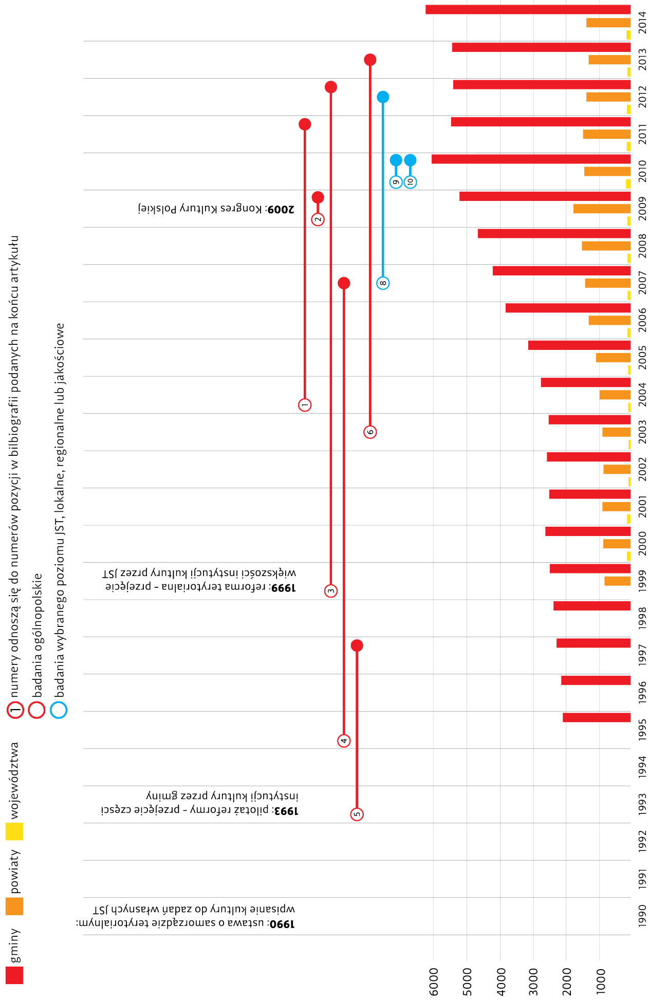
Rysunek 1. Badania dotyczące wydatków budżetów samorządów na kulturę w odniesieniu do okresu obejmującego badania na tle dynamiki tych wydatków w latach 1991-2014